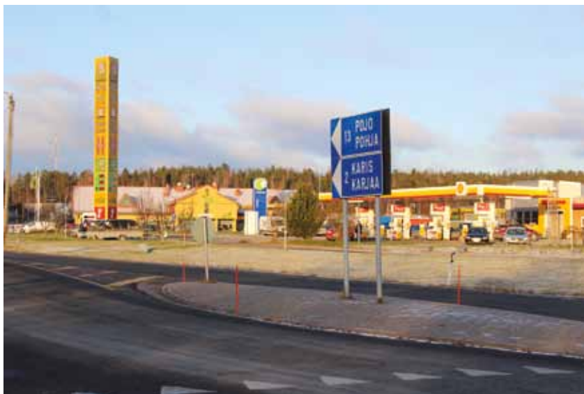
Trafiken vid infarten till Läpp och Karis från riksväg 25 har länge väntat på förbättring. Planerna hänger ihop med butiksområden i både Karis och Ekenäs.

Efter en omfattande diskussion om behovet av bättre kollektivtrafik för att kunna behålla konkurrenskraften i regionen fortsatte kommunerna jaga hållbara lösningar under 2019. I början av året beslöt Sjundeå och Raseborg att fortsätta betala för kvällståget från Helsingfors till Karis och morgontåget från