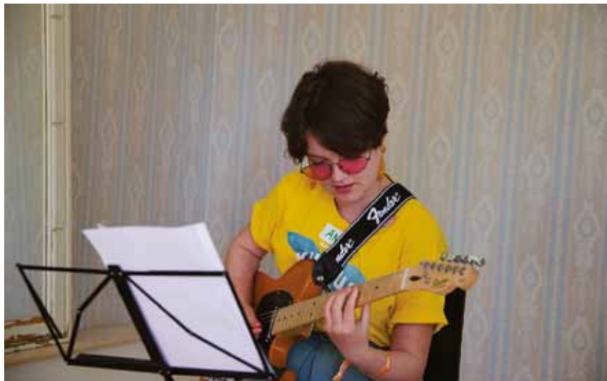
Fender Scandinavia sponsorerar föreningen med högklassig musikutrustning.

deltagare. Bandveckosluten ordnas i samarbete med lokala skolor, föreningar och ungdomsgårdar.