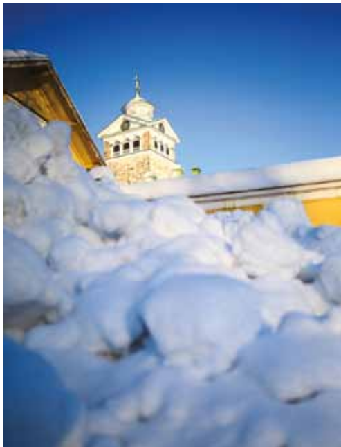
Vädret bjöd på flera överraskningar under 2019, och ledde till diskussioner om huruvida vi står inför en omfattande klimatförändring.

Syrefattiga havsbotten i Östersjön fortsatte också oroa. Redan i januari kom dystra rapporter, och nya uppmaningar om behovet att minska näringsämnen från land gavs av Miljöcentralen. Senare under året diskuterades den globala uppvärmningens påverkan på Östersjön ur flera perspektiv. Vid Tvärminne Zoologiska station har man bland annat märkt att Östersjön värms upp snabbare än andra platser. Sedan början av 1990-talet har man uppmätt en två graders uppvärmning på de djupa kustvattnen utanför stationen. Vad som händer i Arktis och Antarktis är ihopkopplat med vad som sker i Östersjön, och påverkar bland annat mångfalden i havsområdet, salthalten och syretillgången.