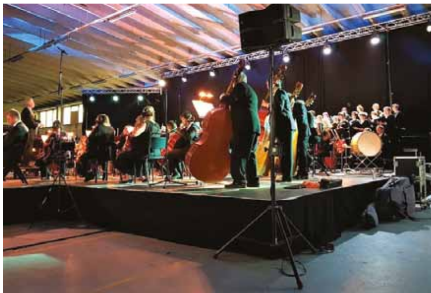
Ekenäs sommarkonserter firade 20 år med jubileumskonsert i Fiskars.

Under de senaste åren har diskussionen om att förlänga evenemangssäsong-en för både invånarna och turismen börjat bära frukt. Även om sommaren fort-