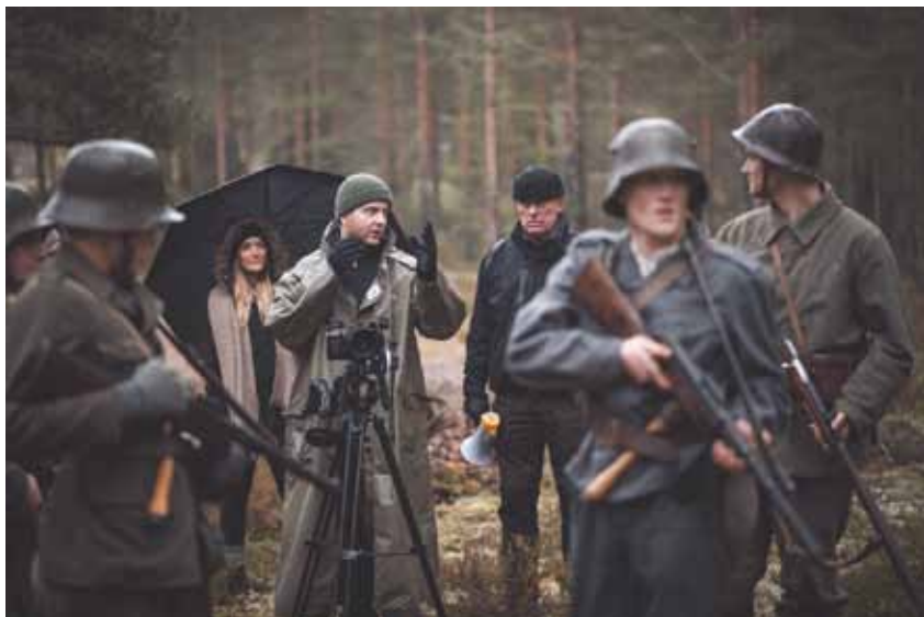
Kriget på Hangö udd och risken för ett sovjetiskt anfall under 1940-talet uppmärksammas i den kommande dokumentären "Harparskoglinjen. Västfronten mot Sovjet", som spelas in på Hangö udd.

Museum i Ekenäs en utställning om spritsmugglingen 1919–1932, i och med att det förflutit 100 år sedan sprit förbjöds i Finland.