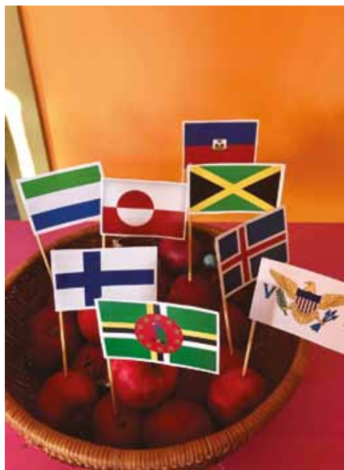
Flaggorna symboliserar alla länder föreningen haft verksamhet i.