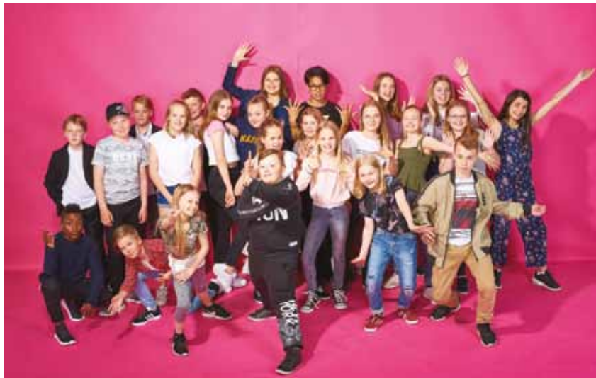
Övningarna för årets Melodi Grand Prix hölls bland annat i Karis.