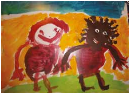
Målningen är gjord av Josefine Fri då hon var 6 år gammal år 2002.

I många andra länder finns dessutom inte ekonomiska möjligheter eller intresse att se till att barn kan ta del av konst och kultur. Vi har med oro sett hur rasismen fått fäste i delar av Finland och vet att det finns grundskolor