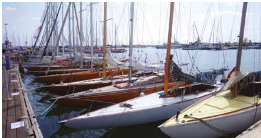
Hangö drog seglingsvärldens blickar till sig med sexornas VM i augusti. Dessutom var Hangögategattan rekordstor.