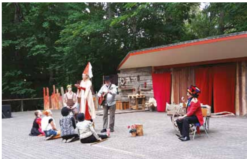
I Tenala sattes sommaren 2019 familjemusikalen Pinocchio enligt Sås & Kopp upp på Museigårdens scen av den nygrundade teaterföreningen SKOTT rf.