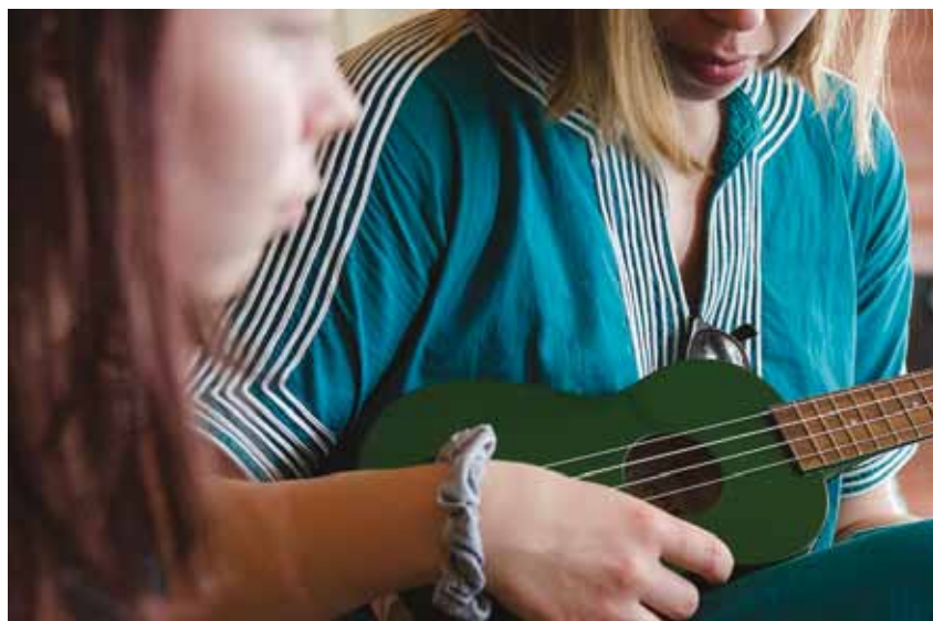
Under lägren får deltagarna ta del av olika verkstäder såsom musikteknologi, ukulele eller perkussion.

Barn behöver förebilder. De behöver se olika sorters vuxna verka inom olika områden. Det ger dem frihet att våga pröva på olika saker för att hitta något