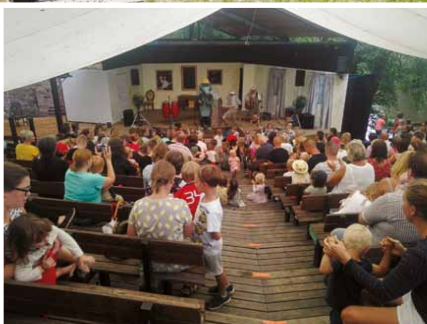
Ekenäs museigård och nedan Svartå Slott med Arne Alligator.