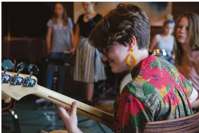
Under lägren ordnas en instrumentkarusell där deltagarna får pröva på bas, trummor, piano, gitarr och sång.

Ett bandveckoslut är en komprimerad och förenklad version av ett läger och ordnas på en lokal nivå utan övernattnig för att undvika logistikostnader för