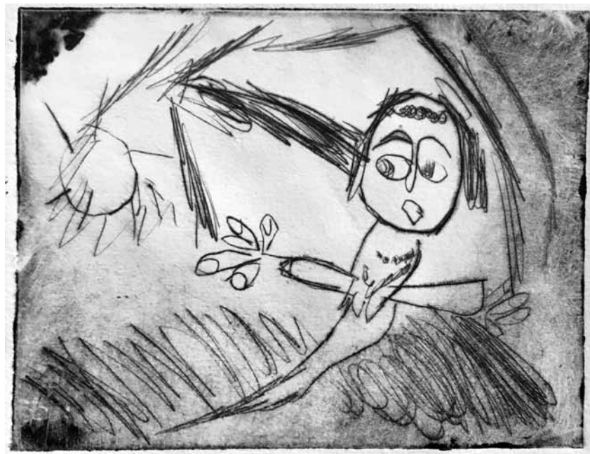
Ilmatar av Osmo Kainulainen är skapad med torr nålsgravyr

Varje elev valde en av figurerna och målade en egen version av personens ansiktsuttryck. Under processen kombinerades abstrakt och figurativ konst. Elev-