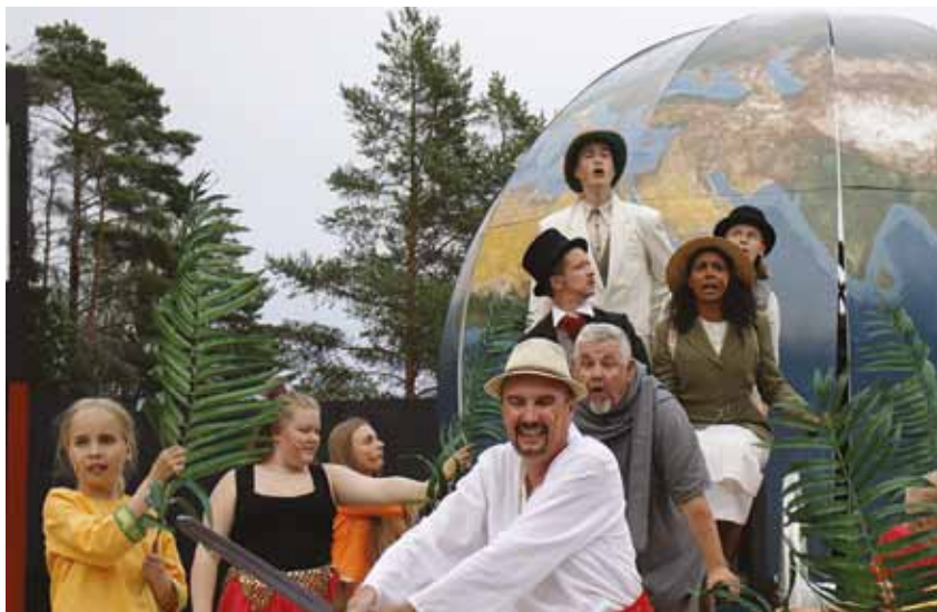
Raseborgs sommartheater tog 2019 en resa runt jorden med pjäsen Jorden runt på 80 dagar .

Kort därefter var det premiär för Kulturhuset Karelias pjäs Lasse-Majas detektivbyrå Sommarmysterierna , den första barnpjäsen som satts upp i egen regi.