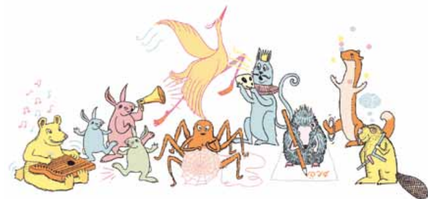
Illustration Frisco Design/Anni Pöyhtäri, Raseborg 2019. (1) arkitektur, (2) bildkonst, (3) slöjd och hantverk, (4) musik, (5) dans, (6) mediekonst, (7) ordkonst, (8) cirkuskonst, (9) och teaterkonst.

I Finland erbjuds grundläggande konstundervisning. Det baserar sig på en förordning och är lagstadgat. 4 Grundläggande konstundervisning är undervisning i olika konstarter som ordnas utanför skolan, i första hand för barn och unga. Undervisningen ger eleverna förmåga att uttrycka sig, samt färdigheter att söka sig till yrkesutbildning och högre utbildning inom konstarten i fråga. Konstarter inom den grundläggande konstundervisningen är arkitektur, bildkonst, slöjd och hantverk, musik, dans, mediekonst, ordkonst, cirkuskonst och teaterkonst.