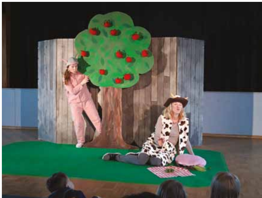
I Prästkulla ordnas årligen barnfester med kulturprogram för barnfamiljer. Under vårens barnfest 2019 visades Grisen som glömde hon var gris i Malmåsa.