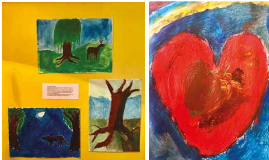
Målningarna på gul bakgrund är utförda av elever på Grönland, målning av hjärta av en elev på Island, båda från september i år.