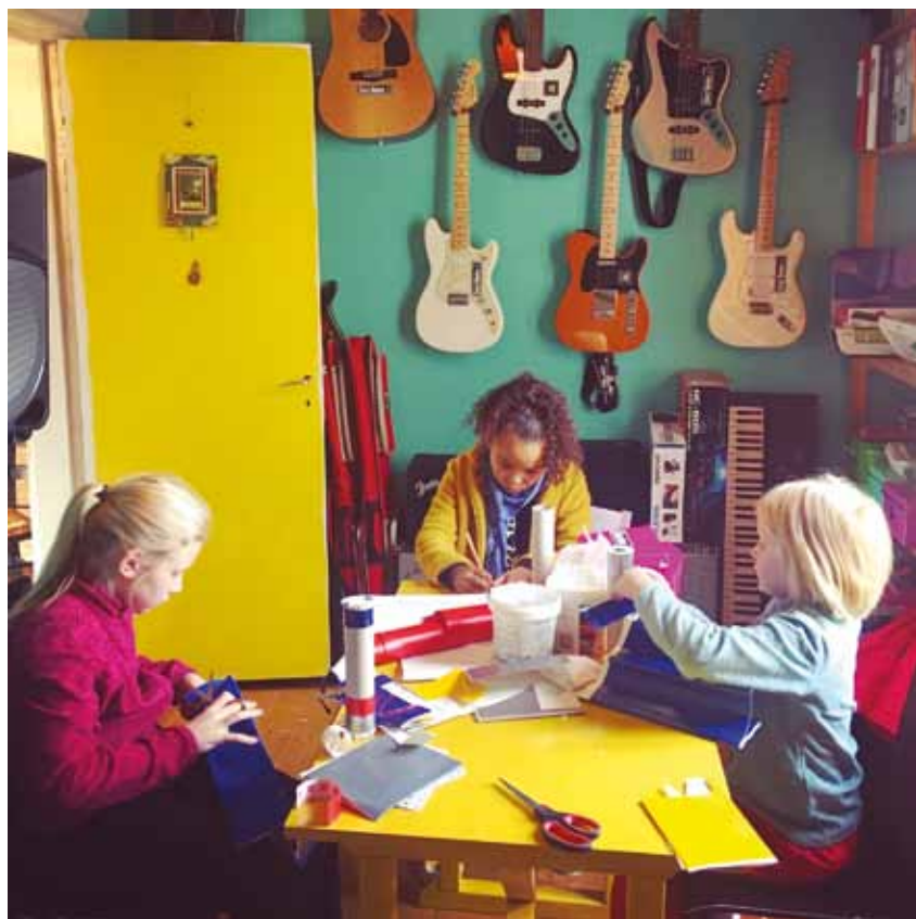
Musikverkstad i Rock Donna-rummet på Wilda sommaren 2019.

I konst-, dans, teater- och musikverkstäder för i första hand barn, men också för alla åldersgrupper, har uppskattningsvis långt över 1 000 personer deltagit under åren. De har fått skapa luffarslöjd, drömfångare, smycken, textilkonst, masker, skrotskulpturer, dans, teater, lekar på engelska, Recycle art, papperskonst, kreativt broderi, vindspel, målningar, collage och mycket mera.