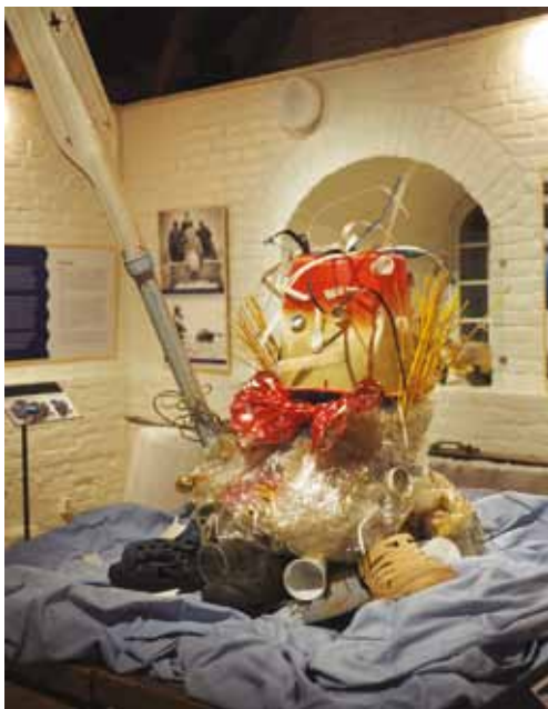
Utställningen Hangö udds förunderliga natur visar även upp skräp som samlats på stadens stränder. Utställningen fortsätter 2020.

ledde dessutom till att männen bakom projektet blev årets raseborgare, då priset delades ut i mars.