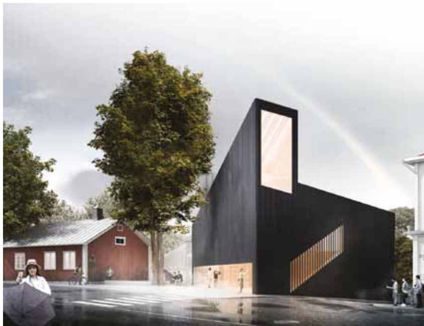
Vinnaren av arkitekttävlingen för det nya konstmuseet i Ekenäs ger staden ett spännande arkitektoniskt inslag.