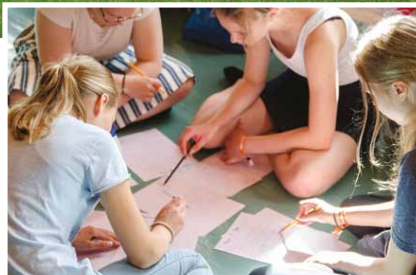
Sommarläger för ungdomar 2019. När man skriver egna låtar kan ingen säga vad som är rätt och fel – bandet bestämmer själv.