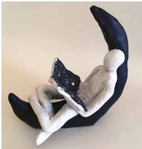
Bokstöd av Tyyne Silvennoinen.

erna funderade också på hur färgval och sätt att måla kan yttra känslor. Med de yngre eleverna bekantade vi oss med Robert Ekmans målning om Ilmatar och myten om världens skapande. Barnen ritade egna versioner av Ilmatar och tryckte sina bilder med torr-nålsgravyr på egentillverkat papper. Det skapades också konstverk med collageteknik av viggan med sina sju ägg som enligt skapelsemyten blev solen, månen, vattnet, jorden, luften och stjärnorna.