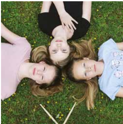
Bandet The Gen Z's från sommarlägret 2019.