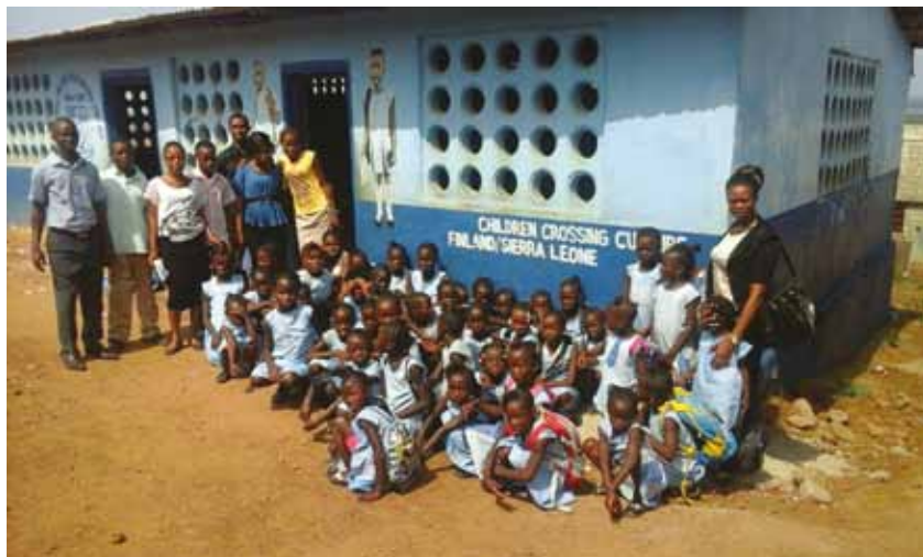
Bild från skolan som föreningen startade i Yamsfarm i Sierra Leone.

vånarna i byn Soufriere uttryckte ett stort behov för verksamheter som kunde glädja barn och ungdomar.